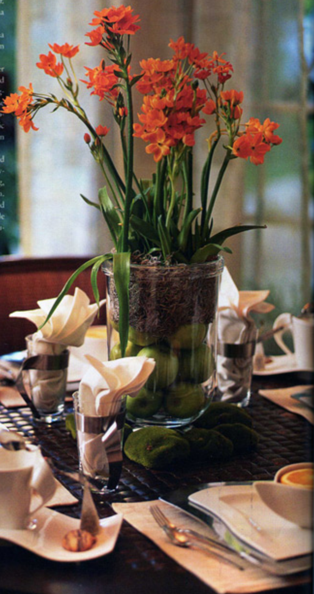
The morning room set for breakfast with place settings from the New Wave Collection by Villeroy and Bosh. El área para el desayuno con juegos de mesa de la colección de New Wave hechos por Villeroy y Bosh.

This one in particular was the Ultimate Garage because it housed the owner's personal collection—a dream car, a vintage motorcycle—as well as a home theater. All the latest products in flooring, wall finishes, cabinetry and lighting were utilized in the design. Unique custom furnishings such as barstools made of upholstered wheel rims, the concrete-road bar top and the floor-jack coffee table all add inspiration to the room and follow the theme of a car enthusiast's dream. Now it's truly an environment that's entertaining!