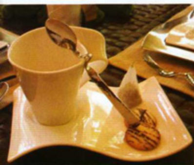
A teacup from the New Wave Collection by Villeroy and Bosh. Otra vista del juego de mesa de la colección New Wave hecha por Villeroy and Bosh.