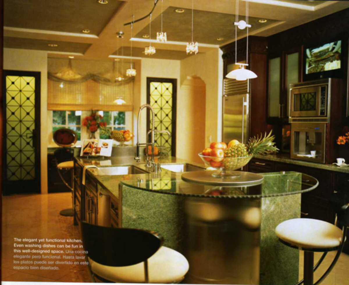
The elegant yet functional kitchen. Even washing dishes can be fun in this well-designed space. Una cocina elegante pero funcional. Hasta lavar los platos puede ser divertido en este espacio bien diseñado.

I have asked the designers to summarize in their own words the inspiration for these rooms. I want you to share their excitement about such stunning work.